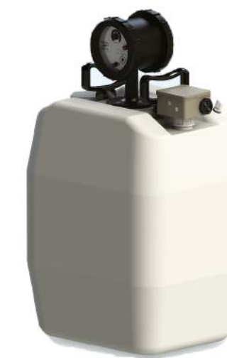
Bomba Dosadora (Opcional)